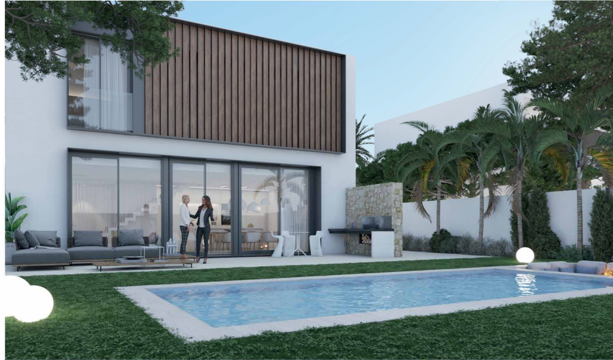
Todas las imágenes utilizadas en este dossier de presentación son para uso comercial y muchos elementos presentes en las imágenes utilizadas son elementos de decoración, como pueda ser lámparas de iluminación, o mobiliario, y puede que no estén incluidas en el proyecto final.