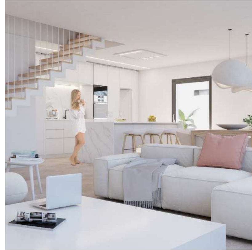
Todas las imágenes utilizadas en este dossier de presentación son para uso comercial y muchos elementos presentes en las imágenes utilizadas son elementos de decoración, como pueda ser lámparas de iluminación, o mobiliario, y puede que no estén incluidas en el proyecto final.